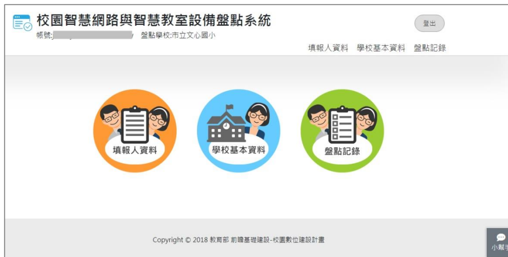
圖 5.學校盤點人員_登入後頁面