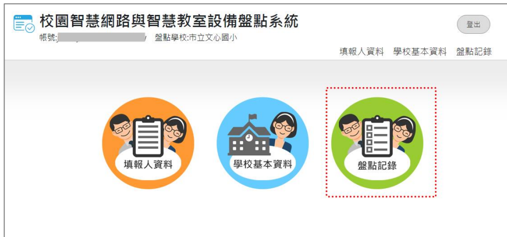
圖 10.學校盤點人員_盤點記錄

盤點記錄共有八大項目需要填寫，分別是「學校網路架構」、「學校連外網路」、「跨棟校舍間之網路連線」、「校園骨幹網路設備資料」、「校園無線網路及漫遊服務」、「校園智慧網路管理」、「各年級教室資料」與「專科教室資料」，可以不按順序填寫。