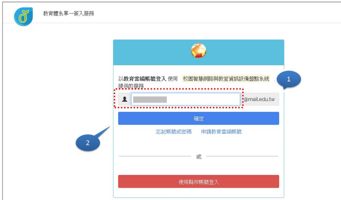
圖 3.學校盤點人員_輸入 Open ID 登入頁