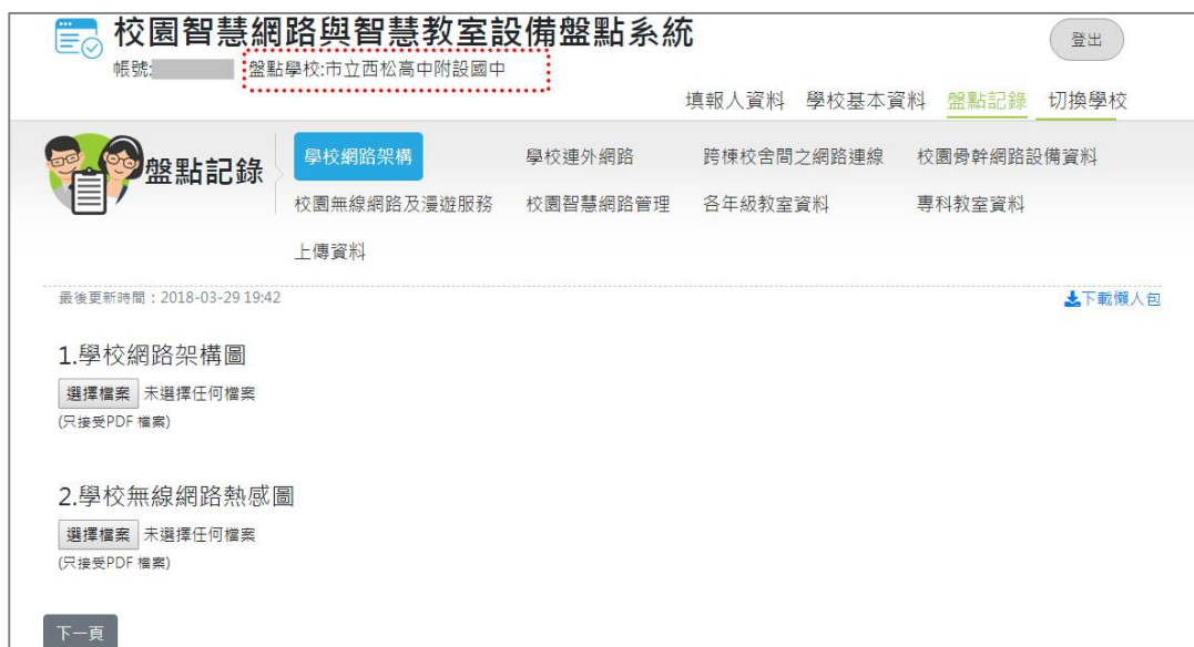
圖 27.學校盤點人員_切換學校(3)