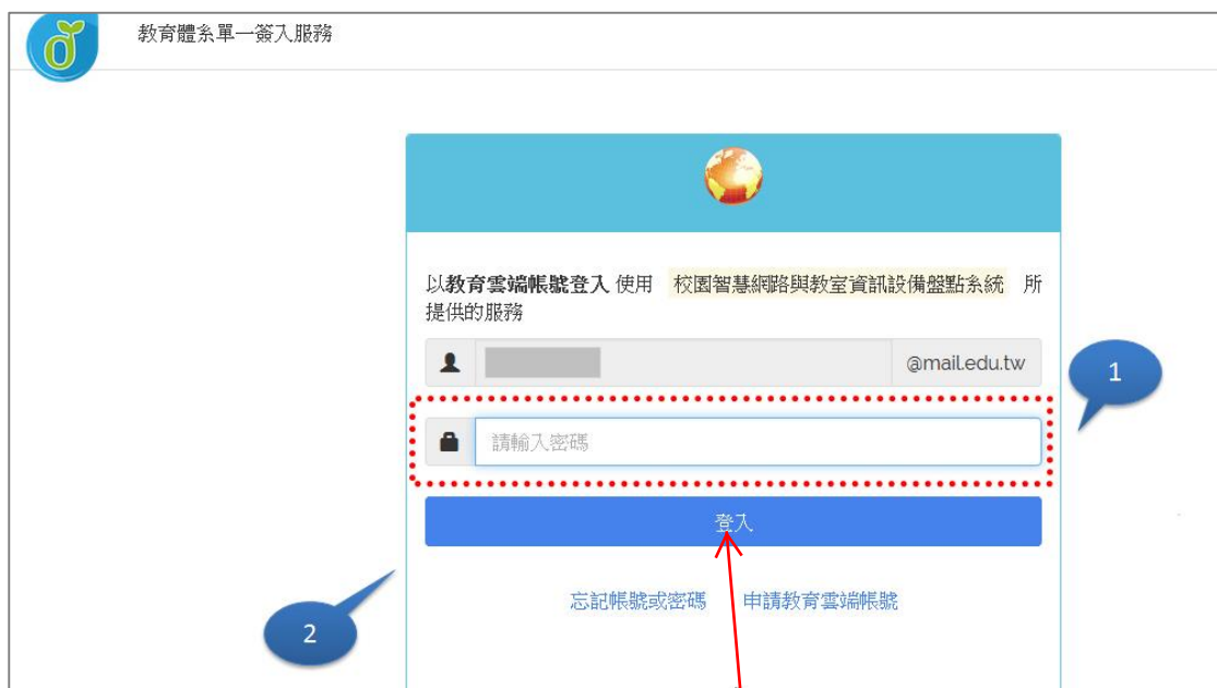
圖 4.學校盤點人員_輸入 Open ID 密碼登入頁

登入後若系統顯示： 【請盡速與您的縣市管理員聯絡，以開通系統登入權限】 請來電縣網中心並告知您的校名及教育雲帳號！