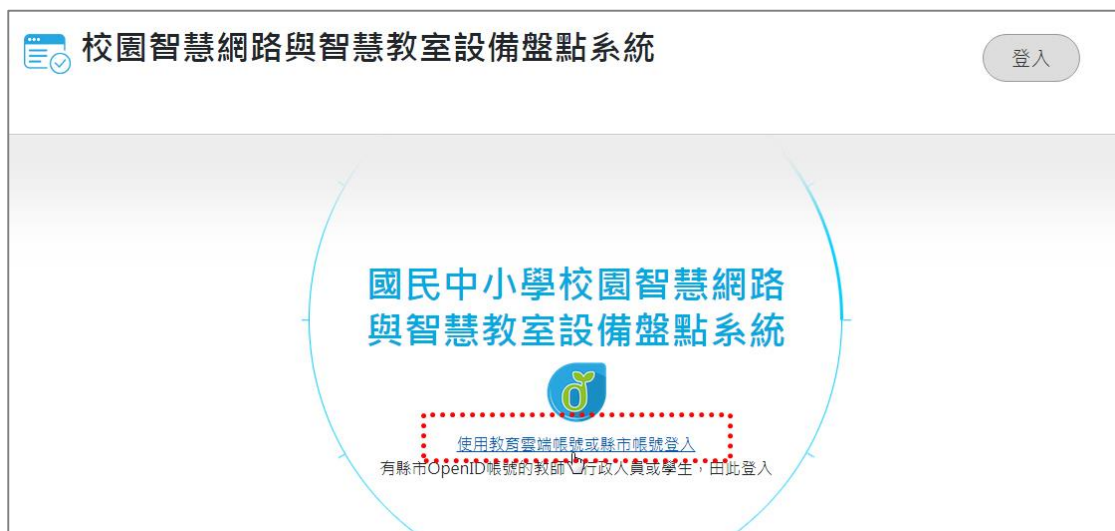
圖 2.學校盤點人員_Open ID 登入頁面頁