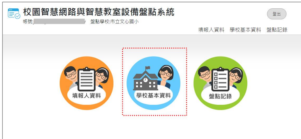
圖 8.學校盤點人員_學校基本資料

學校基本資料包括學校名稱、郵遞區號、地址、電話號碼、學校網址、學校屬性、地區屬性、一般班級數、身障班級數、資優特教班級數、學生人數、設置資訊組長等共 12 個必填欄位。請在輸入完畢後，按「儲存」鈕。