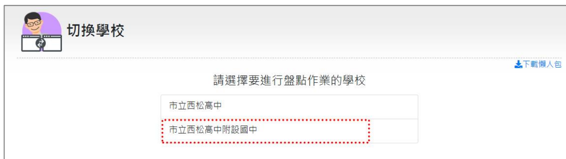
圖 26.學校盤點人員_切換學校(2)