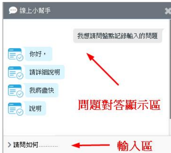
圖 29.線上問題答詢功能_小幫手回覆畫面