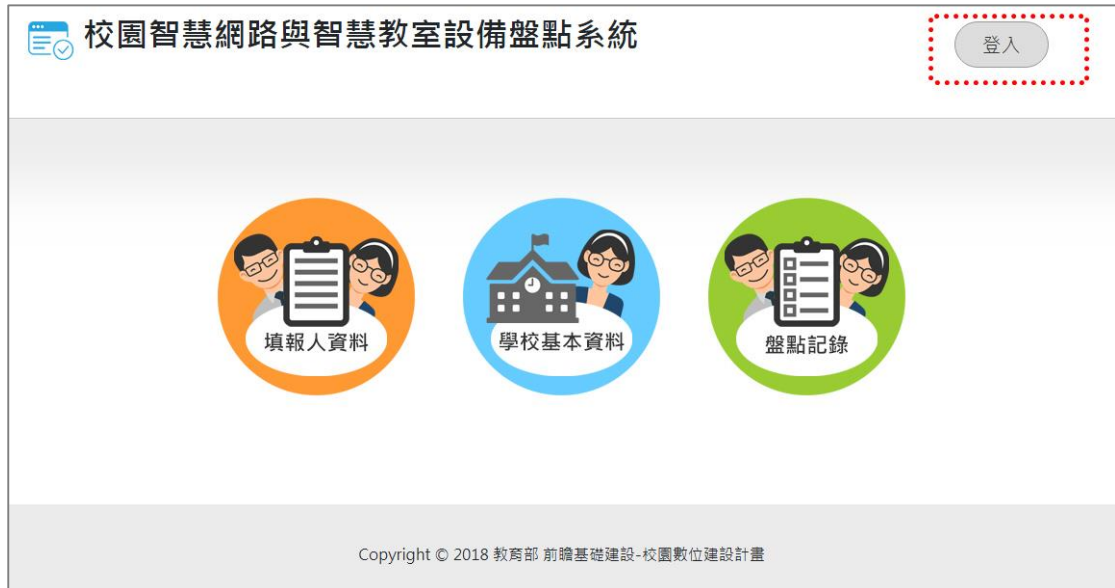
圖 1.學校盤點人員_登入頁面首頁