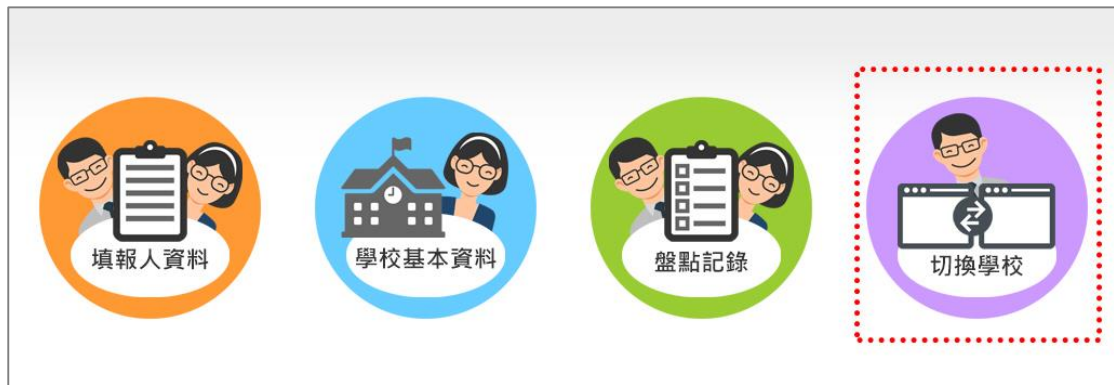
圖 25.學校盤點人員_切換學校(1)