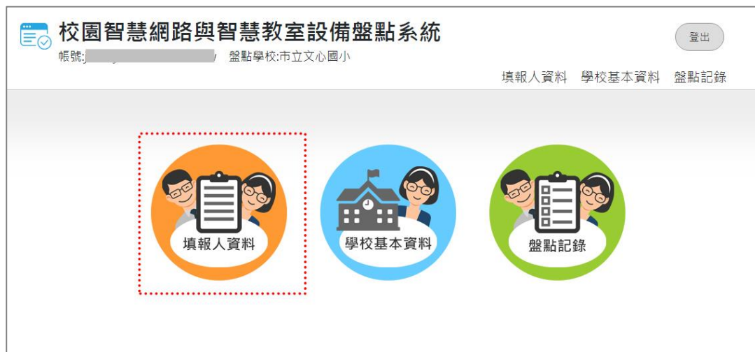
圖 6.學校盤點人員_選擇填報人資料